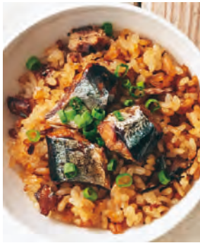
北海道産さんま使用 炊き込みご飯の素(さんま)

北海道産のサンマを一度塩焼きすることで青魚特有の臭いも気にならない、秘伝のタレを使用したさんまの炊き込みご飯の素。骨まで柔らかく食べられ、塩焼きさんまの風味がよりおいしさを増します。