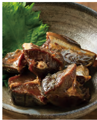
北海道産 寒干棒鱈 やわらか小樽煮

「北海道産寒干棒鱈 やわらか小樽煮」は、厳冬の北海道で獲れた助宗鱈を浜風で寒干しし、数日かけて水で戻した後、昔から伝わる小樽秘伝の醤油ベースの調味液でふっくらと炊き上げました。北海道では助宗鱈の一番おいしい調理法と言われています。