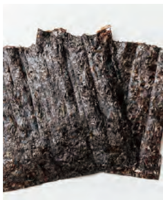
利尻島産 天然岩海苔

利尻島産の希少な天然の岩海苔です。シャキシャキとした歯応えと、芳醇な磯の香りをお楽しみ頂けます。汁物、和え物等にもご使用頂けます。