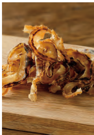
北海道産 帆立貝の焼きひも

北海道沿岸で獲れた新鮮な帆立貝の貝ひもを、旨味を引き立たせるよう昆布、鰹、椎茸の出汁で味付けしたこだわりの逸品です。