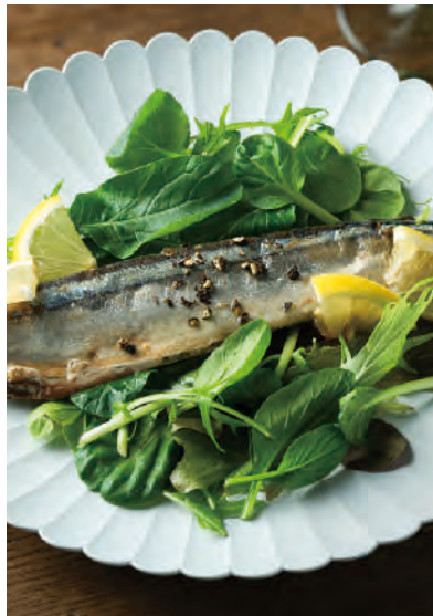
北海道産さんまのコンフィ オリーブオイル煮

コンフィは、食材を低温のオイルでじっくりと煮るフランス南西部発祥の調理方法です。骨ごとお召し上がりいただけますので、そのまま前菜として、ソテーや和風パスタなど幅広くお使いいただけます。