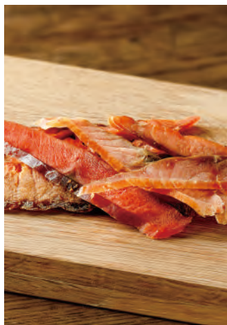
北海道産 サーモンの薄切りとば

北海道沖で漁獲された鮭の皮を取り除き、ソフトで食べやすくスライスしました。素材本来の味をそのまま活かし、さらに昆布・鰹・椎茸を使用したこだわりの出汁を加え、旨味をアップしました。