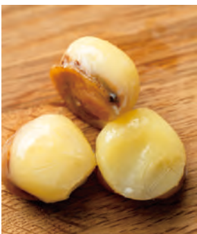
おつまみ燻製 焼き帆立チーズ添え

日本海を巡り物資と文化を運んだ北前船。小樽からも沢山の海の幸が運ばれました。そんな海の幸の旨味を凝縮した特製おつまみ燻製シリーズです。「焼き帆立チーズ添え」は、新鮮で柔らかい帆立貝柱にナチュラルチーズを添えました。