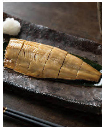
北海道産 焼きほっけ 根室魚醬仕上げ

北海道で水揚げされたホッケを魚醬と昆布塩で味付し、焼き上げてひと口大にカットしました。根室独自の製法で作られたほっけ魚醬を使用し素材の旨みを引き出した、ご飯のおかずにもお酒の肴にもぴったりの逸品です。