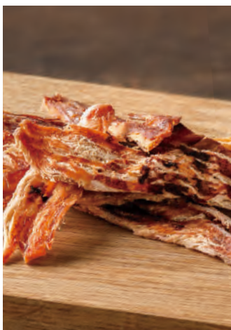
北海道産 黒酢で漬けたスルメイカ

北海道近海で漁獲された新鮮なスルメイカを、旨味を逃さぬように皮をつけたまま、焼きたてをスティック状に裂きました。国産の玄米を使用したやわらかな酸味の米黒酢を調味に、ソフトに仕上げたおつまみです。