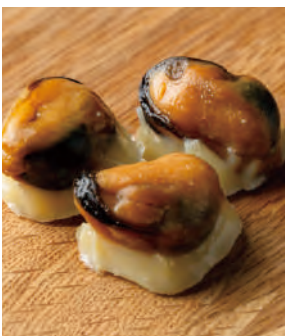
おつまみ燻製 燻製ムール貝チーズ添え

日本海を巡り物資と文化を運んだ北前船。小樽からも沢山の海の幸が運ばれました。そんな海の幸の旨味を凝縮した特製おつまみ燻製シリーズです。「燻製ムール貝チーズ添え」は、桜チップで燻製した香ばしいムール貝にチーズを添えました。