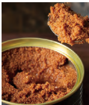
北海道根室の真鱈子 甘辛煮

北海道根室産の真だらを新鮮なうちにさばいた「真だらこ」を、北海道産の醤油と砂糖で味付けしました。真鱈は魚偏に雪と書く通り、冬季に漁が本格化します。ご飯のおともに、お酒の肴に最適な、北の海の幸がたっぷり詰まった一缶です。