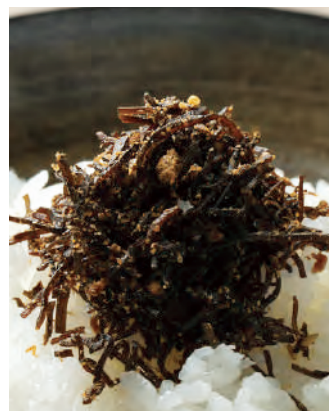
北海道産 鯉と生姜の丁寧仕込み 昆布のふりかけ

炊き立ての白いごはんがもっと美味しくなる逸品。北海道産昆布と鯉節と生姜の三つの素材で作りました。素材のバランスを追求し、旨味と香りが引き立つ味わいに仕上げた厳選こだわりのふりかけです。昆布と鯉節と生姜の香ばしい風味がご飯によく合います。