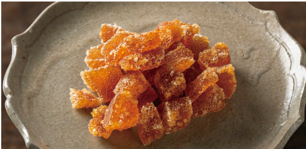
北海道産ナラ材チップ使用 数の子燻製