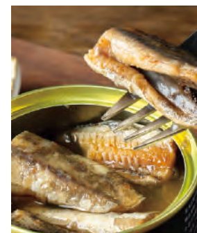
北海道の氷下魚 唐辛子水煮

北海道の冬の海で獲れる「氷下魚(こまい)」。氷に穴を開けて漁獲をする「氷下待ち網漁」は道東の冬の風物詩。一夜干しなどで酒の肴として好まれるこの氷下魚を唐辛子を入れて水煮にしました。マヨネーズやお醤油との相性も抜群です。