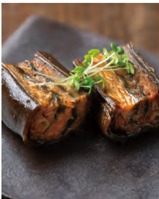
北海道産 鮭と昆布の重ね巻き

鮭の身付き中骨と北海道産昆布をミルフィーユのように重ね合わせ、真空圧力釜にて、程よい食感と甘さに炊き上げました。素材と製法にこだわり、骨まで食べられる栄養価の高い手づくりの逸品です。