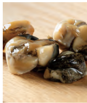
おつまみ燻製 北の燻製つぶ貝

日本海を巡り物資と文化を運んだ北前船。小樽からも沢山の海の幸が運ばれました。そんな海の幸の旨味を凝縮した特製おつまみ燻製シリーズです。「北の燻製つぶ貝」は、北海道産の新鮮なつぶ貝をそのまま燻製にしました。