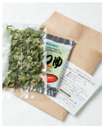
北海道産 行者にんにく 醤油漬けキット

北海道の春の風物詩を年中お楽しみ頂けるキットです。北海道産の乾燥行者にんにくと、羅臼昆布だしが入ったつゆをセットにし、入れるだけで簡単に行者にんにくの醤油漬けをお作り頂けます。(レシピ入り)