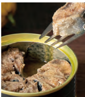
根室七星いわし オリーブ煮 レモン仕上げ

「根室七星」と呼ばれる北海道根室産の真いわし。栄養塩を多く含む道東沖に來遊するため脂がのり、身が締まっているのが特徴。一つ一つ「菊詰め」と呼ばれる花びら型に詰め、オリーブ油で煮ています。レモン果汁でさっぱりと仕上げました。