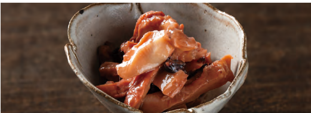
北海道噴火湾産 たこやわらか煮

味が濃いと言われる北海道産のたこを一口サイズにカットし、柔らかくなるまで「直火釜炊き製法」でじっくりと炊き上げました。たこを炊くタレに昆布出汁の旨味を加えた、嗜めば嗜むほど奥深い旨さがお楽しみいただける逸品。