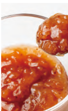
今日ジャム 北海道いちごバター

道内産いちごを丁寧に煮詰めた濃厚ないちごジャムにバターの風味をプラスした今日ジャムおすすめNO2です。