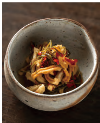
北海道産 大根の昆布醤油漬け 赤とうがらし

北海道産極太切干大根と赤唐辛子、日高産細切り昆布、北海道産昆布だしつゆが入った漬物が作れるキット。袋の中で漬けておくだけで、ピリッとした辛味の漬物がお楽しみいただけます。