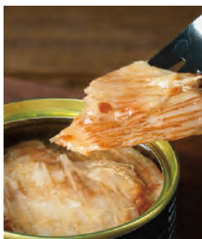
銀ガレイえんがわ醤油煮 (※銀ガレイ:ロシア産又はアイスランド産)

北海道の根室で烏ガレイは別名「銀ガレイ」と呼ばれています。銀ガレイの「えんがわ(縁側)」は寿司ネタとしても人気です。脂が乗っていてコリコリとした食感のえんがわを、北海道産の醤油と砂糖で甘辛く味付けしました。