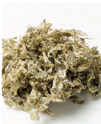
北海道産 荒削りとりろ昆布

北海道産の猫足昆布、真昆布、がごめ昆布の3種類をブレンドし、厚く削ったとりろ昆布です。とろっとした旨味のある粘りが特徴です。汁物、麺類などに入れてご使用頂けます。道東の猫足昆布、道南のがごめ昆布と真昆布を使用しました。