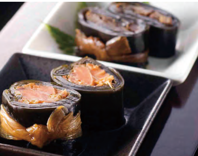
北海道産 やわらか炊き 昆布巻き 帆立

北海道で水揚げされた新鮮な帆立と、厳しい北海道の荒波にもまれた日高昆布を使い、秘伝のたれでじっくりと味付けしました。ご飯のおかずにはもちろん、お酒の肴にもぴったりの逸品です。