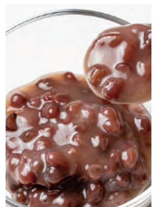
今日ジャム 北海道あずきバター

北海道産のあずき(きたろまん)を使用した濃厚な餡に道産バターのコクをプラスしました。簡単小倉トーストとしても召し上がれます。