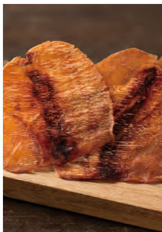
北海道産 やわらかのしいか さんま魚醤

北海道近海で漁獲された新鮮なスルメイカを、旨味を逃さぬように皮をつけたまま、焼きたてをソフトにのしました。根室でとれた鮮度の良いサンマを原料にした、特上の魚醤が隠し味です。