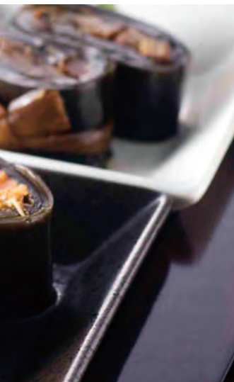
北海道産 やわらか炊き 昆布巻き 柳葉魚

北海道で水揚げされた新鮮な柳葉魚と、厳しい北海道の荒波にもまれた日高昆布を使い、秘伝のたれでじっくりと味付けしました。ご飯のおかずにはもちろん、お酒の肴にもぴったりの逸品です。