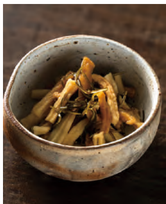
北海道産 大根の昆布醤油漬け

北海道産極太切干大根、日高産細切り昆布、北海道産昆布だしつゆが入った漬物が作れるキット。袋の中で漬けておくだけで、バリバリとした食感の漬物がお楽しみいただけます。