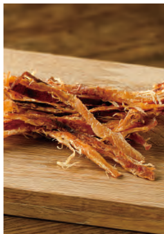
北海道産 いかオリーブオイル&ガーリック

北海道近海で漁獲された新鮮なスルメイカを、旨味を逃さぬように皮をつけたまま、焼きたてを裂きました。刺激を求めて唐辛子、ガーリック、本場イタリアのオリーブオイルを調味に使い、ソフトに仕上げたおつまみです。