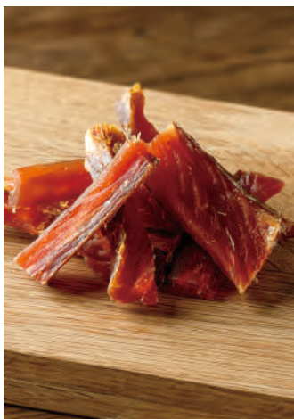
北海道産 サーモンのひと口とば

北海道産の良質な秋鮭を原料に、背骨を取り除き、3枚におろしてから食べやすいように皮を剥いて、乾燥させました。昆布・鰹・椎茸を使用したこだわりの出汁で調味したひとくちサイズのおつまみです。