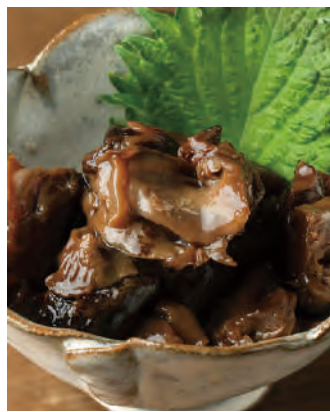
北海道産 ツブ貝 やわらか小樽煮

昔から北海道民にはお馴染みのツブ貝は、最近はサザエと並ぶほど、人気が高くなってきました。「北海道産ツブ貝 やわらか小樽煮」は、昔から伝わる小樽秘伝の醤油ベースの調味液で、ふっくら美味しく炊き上げました。ご飯のおかずにも、お酒の肴にもぴったりの逸品です。