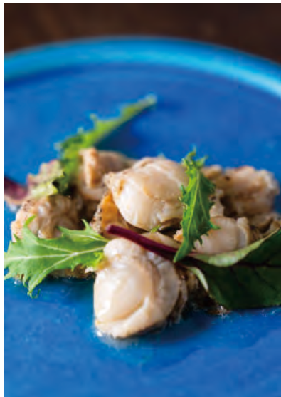
北海道産ほたてのコンフィ オリーブオイル煮

コンフィは、食材を低温のオイルでじっくりと煮るフランス南西部発祥の調理方法です。オリーブ油、なたね油、食塩のみで調理してありますので、そのままはもちろん、サラダやパスタなど幅広い料理にお使いいただけます。