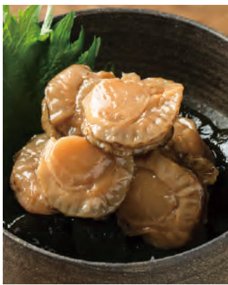
北海道産 帆立貝 やわらか小樽煮

海中で泳ぐ姿が、帆を上げて風に乗って走る帆船のようであることから「帆立貝」と呼ばれます。「北海道産帆立貝 やわらか小樽煮」は栄養たっぷりの北の海で育った帆立を、昔から伝わる小樽秘伝の調味液でふっくら美味しく炊き上げました。