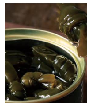
北海道さお前昆布 やわらか煮

北方四島の貝殻島産の棹前(さおもえ)昆布を一つ一つ丁寧に結び、北海道産の醤油でじっくり煮付けた逸品です。味のしみ込んだ昆布はとてもやわらかく、昆布の旨味が食欲をそそります。