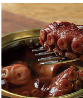
北海道根室の銀だこ やわらか煮

寒い海域に生息する柳だこは、太平洋側での漁獲が水揚げの80%以上を占め、根室では「銀だこ」の相性で親しまれています。その銀だこを、根室で人気のほまい昆布醤油と砂糖で甘辛く味付けし、歯ごたえのある柔らかさに仕上げました。