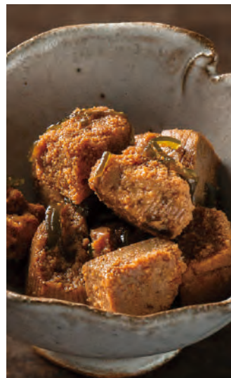
北海道産 鱈子と昆布の旨煮

北海道産真鱈の卵を手作業で丁寧に取り、真鱈子本来の旨味とプチプチとした食感を堪能できるように『直火釜炊き製法』でじっくりと炊き上げました。鱈子の旨味を引き出すために別炊きしたさざみ昆布を加えることで、両方の食感が楽しめる逸品。