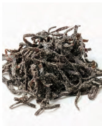
北海道産 汐こんぶ

北海道産の塩・昆布を使って作った、旨味溢れるご飯のお供です。おにぎりの具材、お茶漬けにもお使い頂けます。