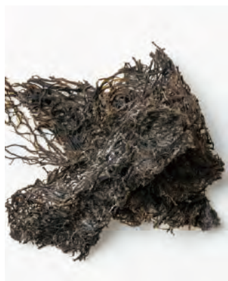
礼文島産 乾燥天然もずく

礼文島産で限られた時期にだけ収穫される、希少な天然もずくを、便利な乾燥タイプにしました。水で戻せば生の食感に戻り、強い粘りとシャキシャキコリコリとした食感をお楽しみ頂けます。酢の物や汁物におすすめです。