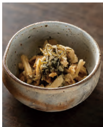
北海道産 大根の昆布醤油漬け 山わさび

北海道産極太切干大根と山わさびパウダー、日高産細切り昆布、北海道産昆布だしつゆが入った漬物が作れるキット。袋の中で漬けておくだけで、ツーンとした辛味の漬物がお楽しみいただけます。