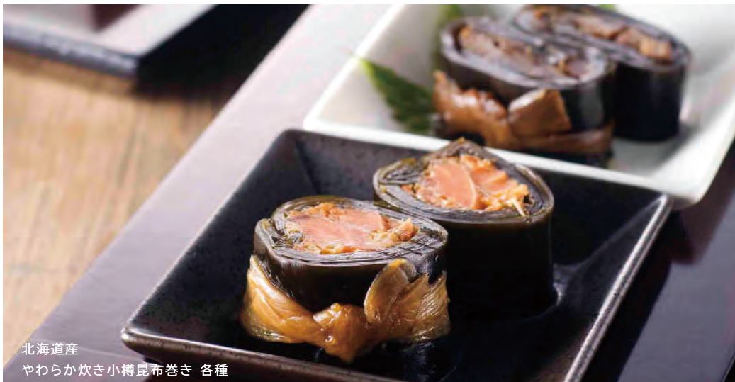
北海道産 やわらか炊き小樽昆布巻き 各種