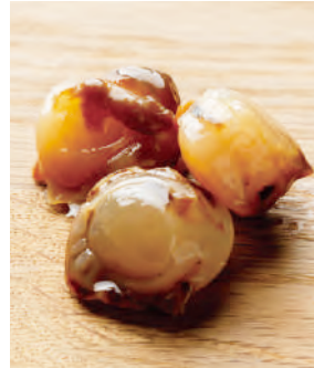
おつまみ燻製 浜焼き帆立貝柱

北海道産素材の燻製が、おつまみにちょうどよいサイズで登場。香り立つスモークのこうばしさに、お酒がすすみます。