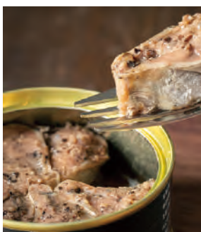
北海道根室のさんま 黒胡椒醤油煮

根室花咲港に水揚げされる新鮮なさんまを使用。北海道東ではさんまの刺身を食するときには醤油に胡椒を入れるのが一般的。一つ一つ「菊詰め」と呼ばれる花びら型に詰め、昔から地元で愛される味付を缶詰でも表現しました。