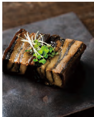
北海道産昆布使用 鯨と昆布の重ね巻き

脂の乗ったニシンと北海道産昆布をミルフィーユのように重ね合わせ、真空圧力釜にてじっくり炊き上げました。素材と製法にこだわり、薄味に仕上げました。昆布とニシンの絶妙な味をご堪能下さい。