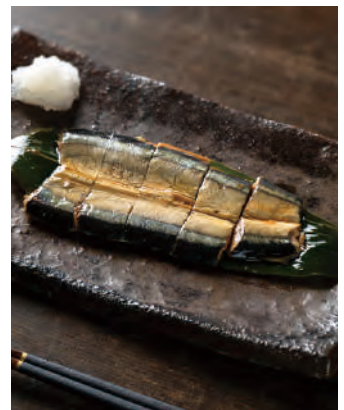
北海道根室産 焼きさんま 根室魚醬仕上げ

北海道根室で水揚げされたサンマを魚醬と昆布塩で味付し、焼き上げてひと口大にカットしました。根室独自の製法で作られたさんま魚醬を使用し素材の旨みを引き出した、ご飯のおかずにもお酒の肴にもぴったりの逸品です。