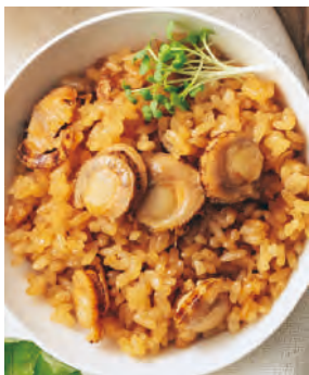
北海道産ほたて使用 炊き込みご飯の素(ほたて)

北海道産のペビー帆立を使用した炊き込みご飯の素。秘伝のタレと帆立の風味や煮汁が出汁となり、薫り良く美味しく炊きあがります。お好みの具材を加えてオリジナルの炊き込みご飯も作れます。