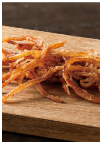
北海道産 手焼きささいか 唐辛子

北海道近海で漁獲された新鮮なスルメイカを、旨味を逃がさぬように皮をつけたまま、焼きたてを細かく裂きました。サンマ魚醤を隠し味に使い、こだわりの唐辛子をまぶしたピリ辛のおつまみです。