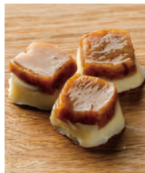
おつまみ燻製 雲丹蒲鉾チーズ添え

日本海を巡り物資と文化を運んだ北前船。小樽からも沢山の海の幸が運ばれました。そんな海の幸の旨味を凝縮した特製おつまみ燻製シリーズです。「雲丹蒲鉾チーズ添え」は、雲丹をたっぷり練りこんだ鱈のすり身にチーズを添えました。