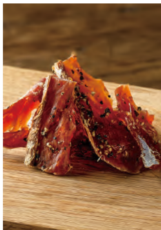
北海道産 サーモンのひと口とば 黒胡椒

北海道産の良質な秋鮭を原料に、背骨を取り除き、3枚におろしてから食べやすいように皮を剥いてから、乾燥させました。刺激を楽しむようにブラックペッパーを隠し味に使用しています。昆布・鰹・椎茸を使用の出汁で調味したひと口サイズのおつまみです。