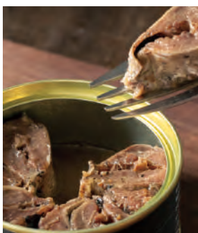
根室七星いわし 甘辛煮 山椒香味

「根室七星」と呼ばれる北海道根室産の真いわし。栄養塩を多く含む道東沖に來遊するため脂がのり、身が締まっているのが特徴。一つ一つ「菊詰め」と呼ばれる花びら型に詰め、北海道産の醤油と砂糖で味付けし、山椒でアクセントを加えました。