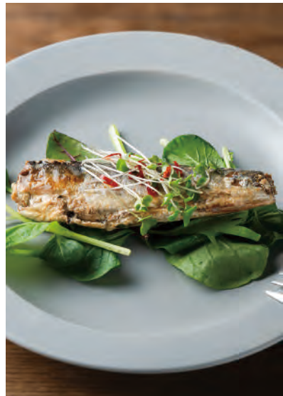
北海道産いわしのコンフィ オリーブオイル煮

コンフィは、食材を低温のオイルでじっくりと煮るフランス南西部発祥の調理方法です。骨ごとお召し上がりいただけますので、そのまま前菜として、和風パスタやパケットとアレンジするなど幅広くお使いいただけます。