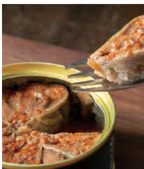
北海道根室のさんま 唐辛子醤油煮

根室花咲港に水揚げされる新鮮なさんまを使用。北海道東ではさんまの刺身を食するときには醤油に唐辛子を入れるのが一般的。一つ一つ「菊詰め」と呼ばれる花びら型に詰め、昔から地元で愛される味付を缶詰でも表現しました。